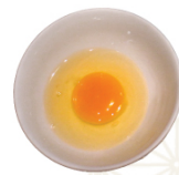
JAPANESE EGG 国産卵 日本雞蛋 🍗 $10