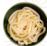
INANIWA UDON 稲庭うどん 稲庭烏冬 $20