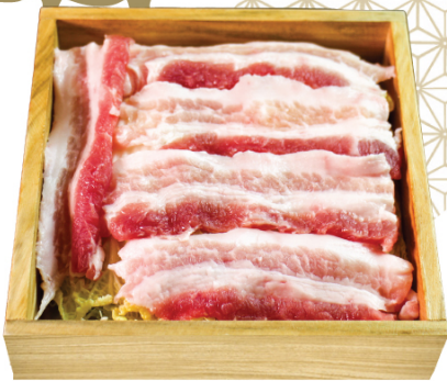
PORK BELLY 豚バラ 五花豚肉 $48