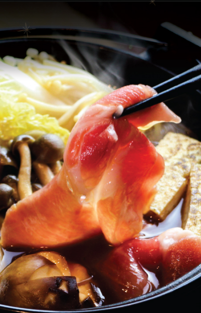
SUKIYAKI すき焼き 壽喜燒