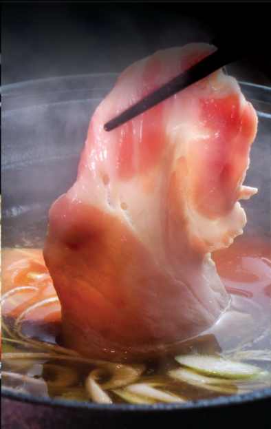
SHABU-SHABU しゃぶしゃぶ 昆布湯