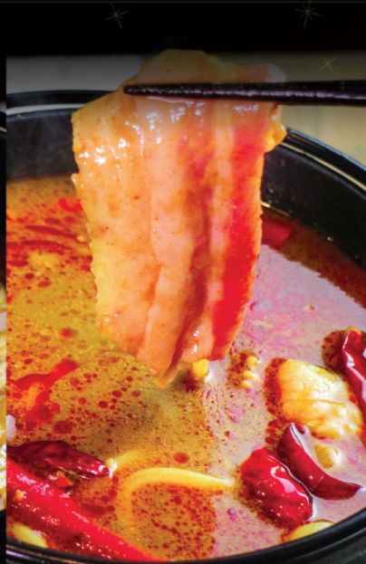
SPICY CURRY POT 激辛カレー鍋 激辛咖哩鍋