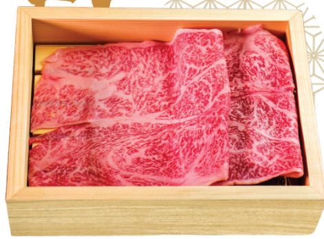
A4 WAGYU SHOULDER RIBEYE A4和牛肩ロース A4和牛肩里脊 🍗 $65