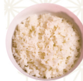
JAPANESE RICE 日本米 日本米飯 $20