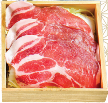
PORK SHOULDER LOIN 豚肩ロース 豚肩里肌 $48