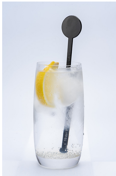
PORKER LEMON SQUASH