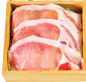
PORK SERLOIN 豚ロース 豚肉里肌 $48