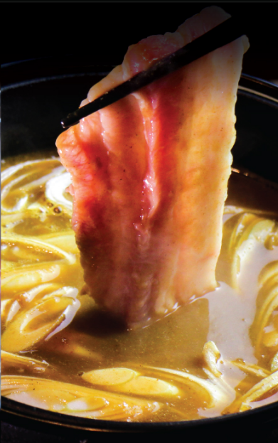
CURRY POT カレー鍋 咖哩鍋